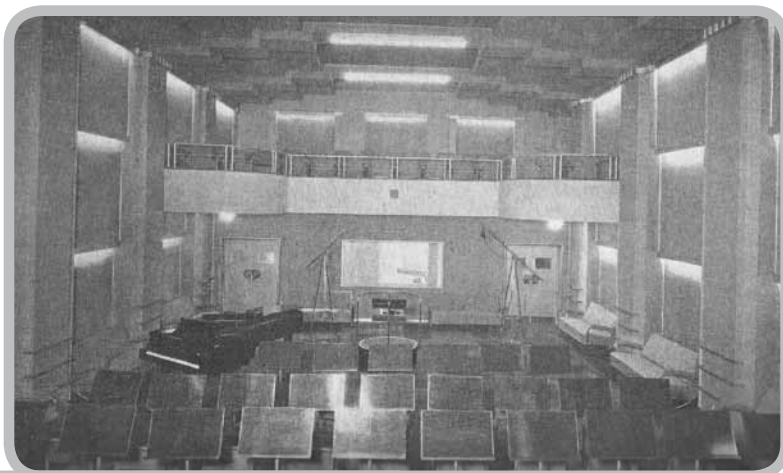
[Estúdio A da EN]

Nos anos que se seguiram à inauguração oficial da EN, foram feitas várias alterações no funcionamento da estação. Em 1937 a potência do emissor de Onda Curta foi elevada para 10 kW, o que demonstrava a importância dada às emissões para as colónias e para os emigrantes. Em 1940 a Emissora Nacional liberta-se da tutela da Administração-Geral dos Correios e Telégrafos e transforma-se num organismo autónomo, sendo publicada a lei que apresenta a primeira fase dos planos da radiodifusão nacional. Assim sendo, é instalado, provisoriamente, o Emissor Regional do Nor-