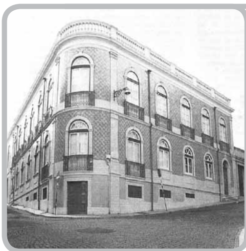
[Edifício da EN, na Rua do Quelhas]

Apesar dos 20 kW do emissor de Onda Média, a EN não era escutada em condições no