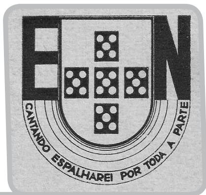
[Logótipo da Emissora Nacional]

A Emissora Nacional de Radiodifusão (EN) inaugurou oficialmente a sua actividade a 1 de Agosto de 1935. Este acontecimento deu-se uma década após as primeiras emissões regulares de rádio em Portugal e numa altura em que a rádio portuguesa vivia o seu primeiro período áureo. Obra do Estado Novo, a EN manter-se-ia sem desvios no seu rumo até o dia 25 de Abril de 1974.